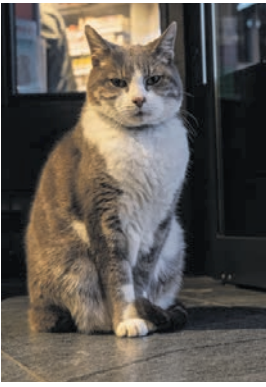
Kater «Mickey»

Kater «Mickey», der oft vor dem Coop beim Vaduzer Städtlemarkt anzutreffen ist, wurde von einem Auto angefahren. Die Besitzerfamilie schreibt auf Facebook: «Unser geliebter Kater hat seinen Oberarm gebrochen.» Das Tier musste operiert werden. Nun wird der 16-jährige Kater «Mickey» zur Heilung für mehrere Monate zu Hause bleiben. Eine aufmerksame Einkäuferin hat bemerkt, dass es dem Kater nicht gut geht und die Tierärztin alarmiert. «Wir bedanken uns von Herzen bei ihr», schreibt die Besitzerfamilie. (vb)