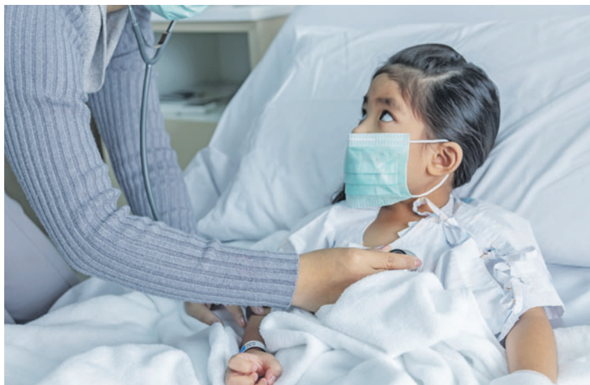
Im Kanton Graubünden wurden zwei Kinder positiv getestet.

Wichtige Telefonnummern: Landesspital: +423 235 45 32 Amt für Gesundheit: +41(0)58 463 00 00