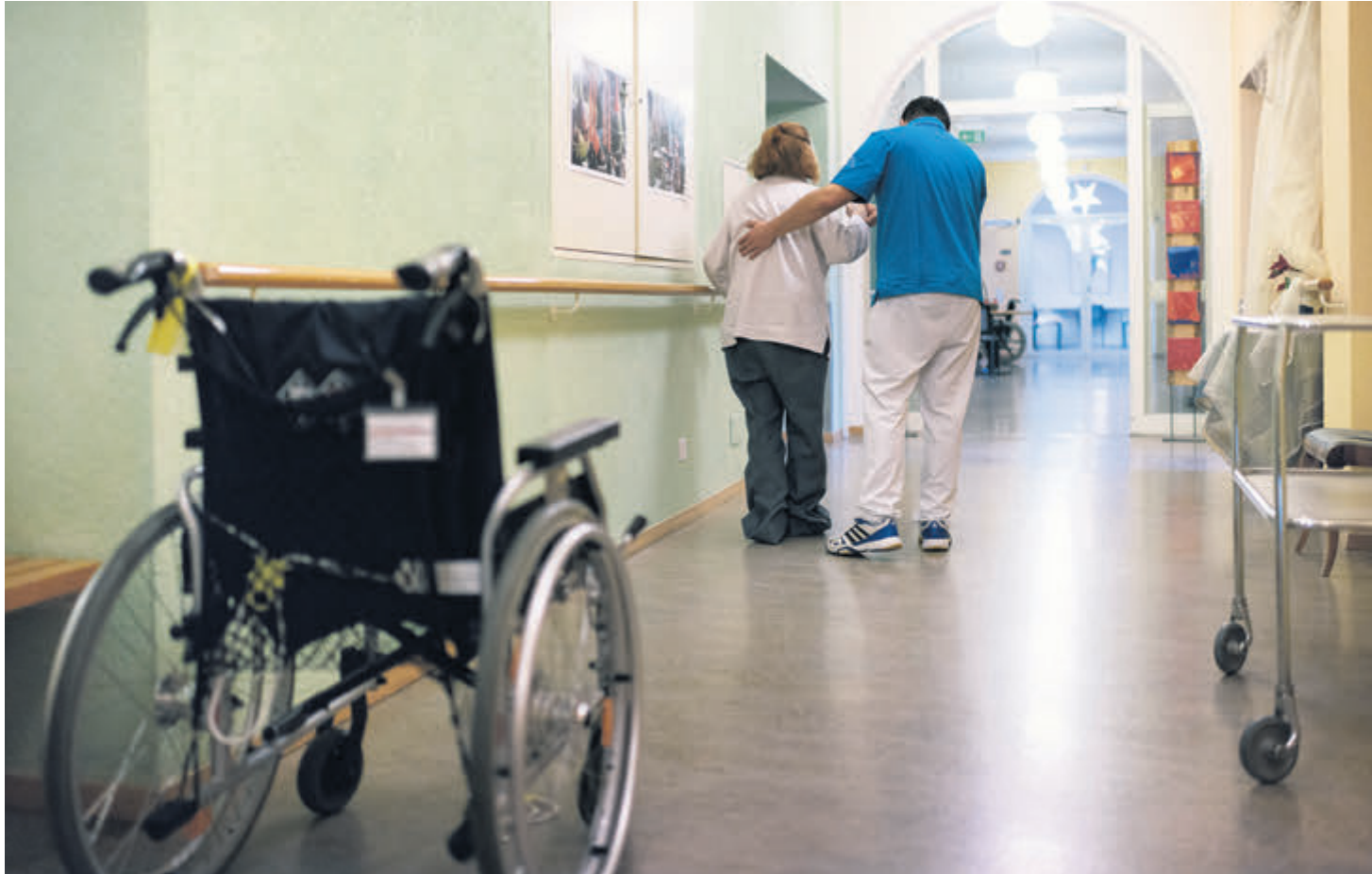
Die Regierung zeigt Modelle auf, wie der «Überalterung» der Gesellschaft entgegenzutreten ist.

Die Stiftung Zukunft.li schlägt hingegen vor, dass ein individuelles Pflegekapital erstellt wird. Ausgangspunkt der Überlegungen ist ein monatlicher Sparbeitrag. Die Sparpflicht beginnt dabei ab 45, 50 oder 55 Jahren und der Beitrag macht dabei 100, 175 oder 250 Franken aus. Dies solange, bis ein definierter Pflegebedarf