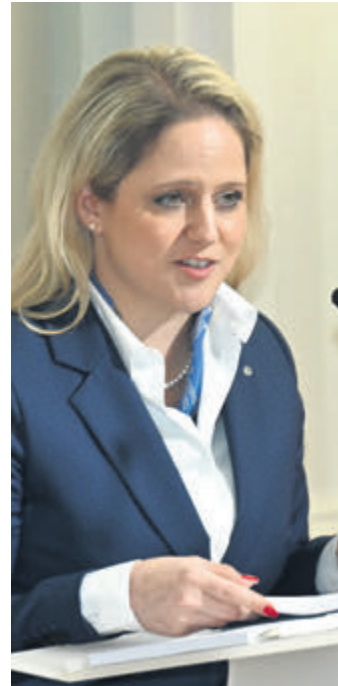
Gesundheitsminister Mauro Pedrazzini, Regierungschef-Stellvertreter Daniel Risch und Kulturministerin Katrin Eggenberger informieren über die «Winterruhe» Liechtensteins.