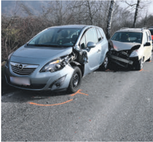
Verletzt wurde beim Auffahrunfall niemand.

Am Dienstag ereignete sich in Schaan ein Verkehrsunfall mit drei Fahrzeugen. Verletzt wurde niemand. Ein Autofahrer war gegen 14.40 Uhr auf der Benderer Strasse in nördliche Richtung unterwegs. Als das vor ihm fahrende Auto verkehrsbedingt seine Geschwindigkeit reduzieren musste, kollidierte er mit diesem und schob es in den davorstehenden Lieferwagen. An allen Fahrzeugen entstand Sachschaden. (lpfl)